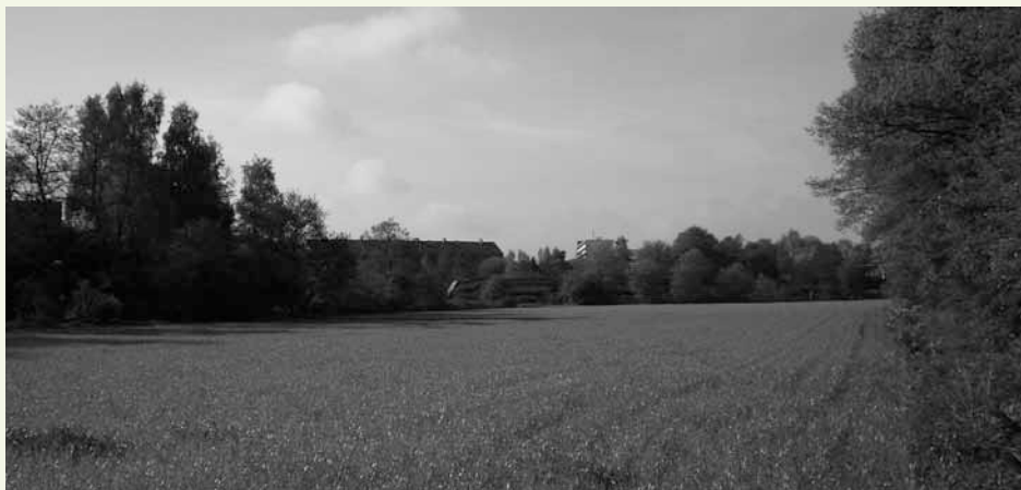
De Leyen-zuid hoe het nu is

De Wijkraad stelt zich op het standpunt dat er, naast de problemen met betrekking tot het voorstel tot het bouwen van een woonzorgcentrum, ook oplossingen moeten komen voor o.a. het laad- en losprobleem bij de Plusmarkt; aandacht voor veiligheid van fietsers op de Berlagelaan en een goede ontsluiting van de wijk bij de spoorwegovergang. Het aanbod van de wethouder was om, gelet op zijn positieve ervaringen met de klankbordgroep ontwikkeling stationsgebied, ook voor dit project een klankbordgroep in te stellen. Deelnemers zijn bewoners en een afvaardiging van de Wijkraad. De groep geeft advies aan de wethouder, maar heeft geen besluitvormend kader. De Wijkraad heeft hierin schoorvoetend toegestemd en hierbij aangetekend dat zij haar onafhanke-