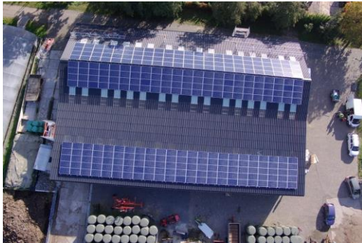
Nieuw Toutenburg Maartensdijk