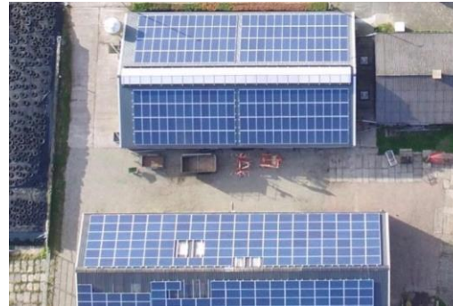
De Hooierij – De Bilt