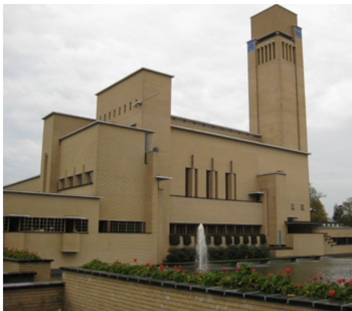
Raadhuis Hilversum - 1926

door Dudok ontworpen was. Vergelijkbare panden waren het jaar daarvoor gebouwd in Tilburg. Enkele andere grote opdrachten die in de naoorlogse jaren werden uitgevoerd waren de gebouwen van de Hoogovens, het raadhuis te Velsen (1949-1965), het Havengebouw in Amsterdam (1965-1957) en de Julianaflat in Bithoven in de typerende bakstenen, inclusief de voormalige boekhandel (1955-1958).