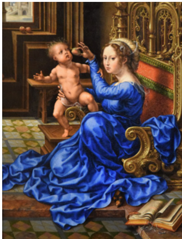
Madonna en Kind, c1530

voor glasvensters, figuurschetsen en ricordi. Sommige tekeningen dienden mogelijk zelfs als zelfstandige kunstwerken.