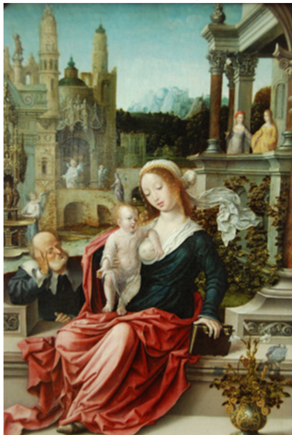
De Heilige Familie, c1510