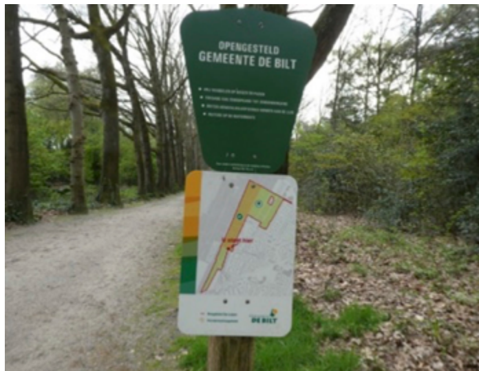
Honden losloopgebied, het geeft aan waar men staat, het enige bord

Ook ging het over achterstallig onderhoud van de openbare ruimte o.a. losliggende stoeptegels. De borden honden losloopgebied in het Leyense bos, zonder windstreken en geven niet aan waar men staat, dat kan beter. (zie foto)